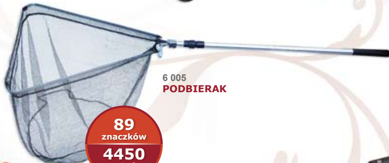
6 005 PODBIERAK