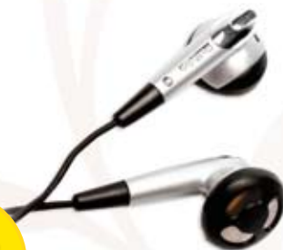
1 016 SŁUCHAWKI DOUSZNE