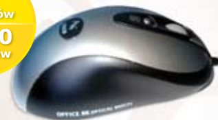
1 017 MYSZKA DO KOMPUTERA