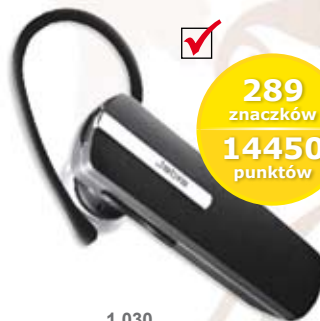
1 030 SŁUCHAWKA BLUETOOTH