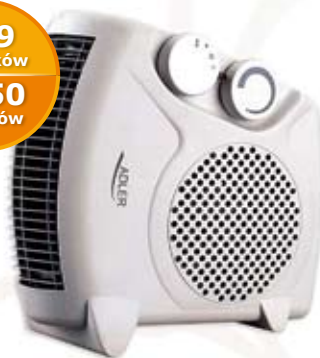
2 048 TERMOWENTYLATOR STING ST901