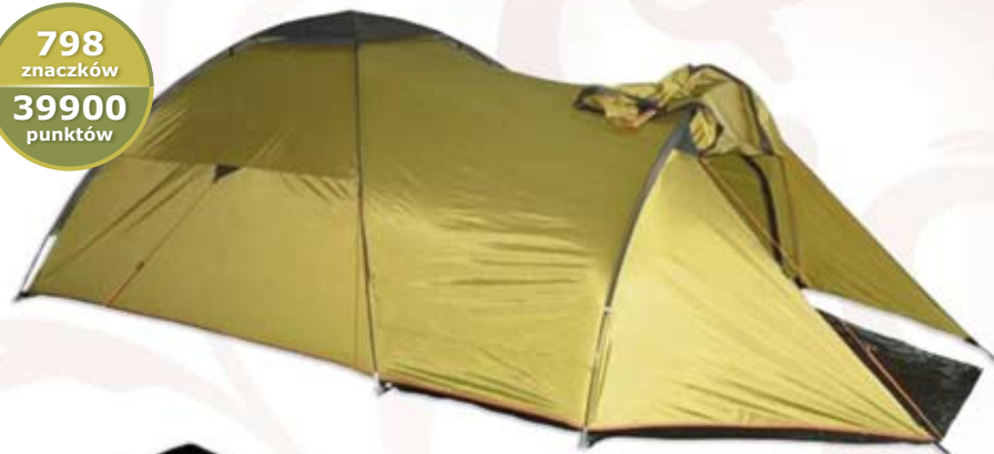
5 016 NAMIOT VAIL3 CAMPUS