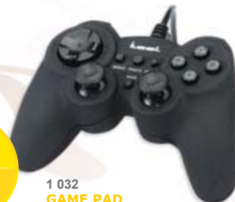
1 032 GAME PAD