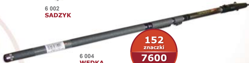
6 004 WĘDKA