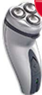
3 011 GOLARKA MĘSKA 3 GŁOWICOWA ADLER