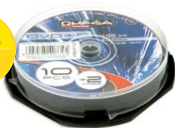
1 015 KOMPLET PŁYT DVD+R 4,7 GB