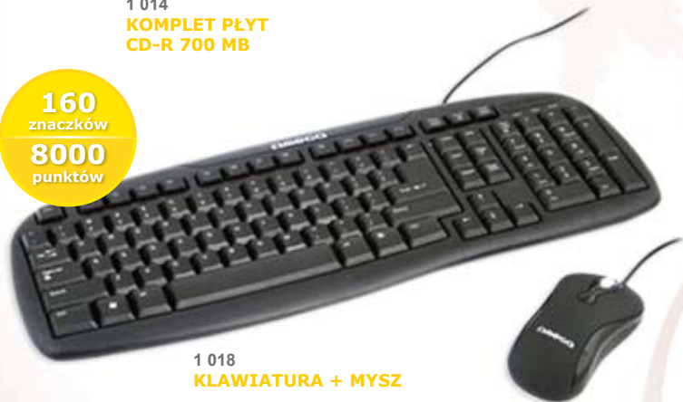
1 018 KLAWIATURA + MYSZ