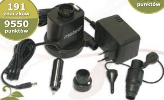
5 020 POMPKA ELEKTRYCZNA METEOR