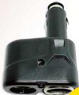
1 027 ROZDZIELACZ DO ZAPALNICZKI