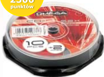
1 014 KOMPLET PŁYT CD-R 700 MB