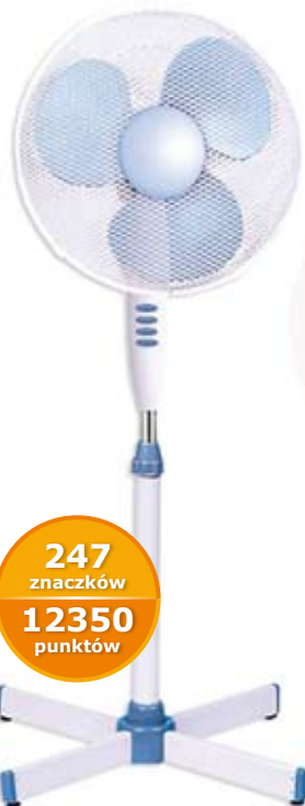
2 113 WENTYLATOR BIURKOWY