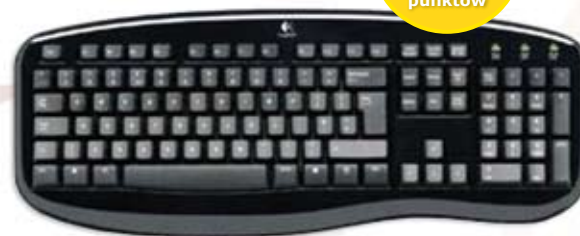
1 019 KLAWIATURA ERGONOMICZNA USB