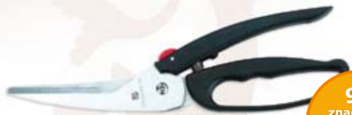
2 061 UNIWERSALNE NOŻYCE KUCHENNE IRIS